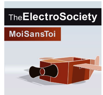
Moi Sans Toi Single 2019