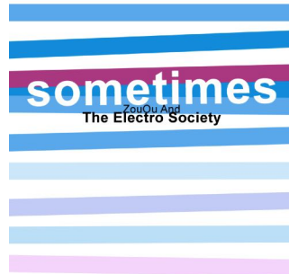
Sometimes Single 2017