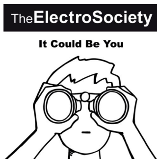
It Could Be You Single 2019