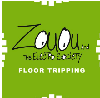
Floor Tripping Single 2017